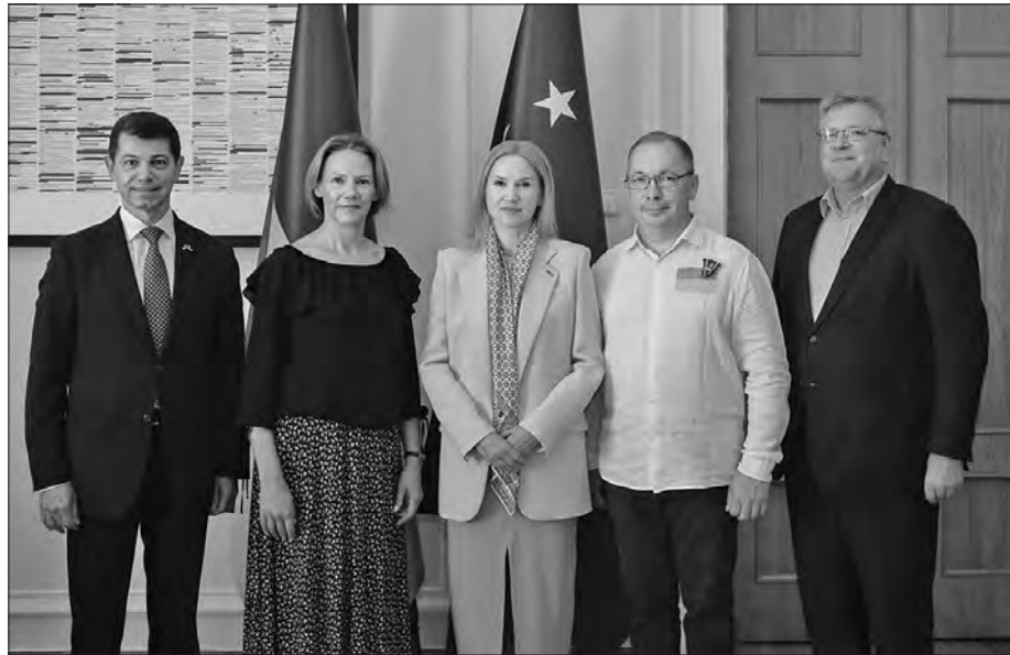
На цьому Заступниця Голови Верховної Ради України Олена Кондратюк наголосила під час зустрічі з Послом Латвії в Україні Ілгварсом Клявою та делегацією латвійських підприємців, які беруть активну участь у наданні допомоги Україні (на знімку).

Віцепікерка висловила ширшу вдячність Латвії як державі за безпрецедентну військову допомогу ЗСУ на суму