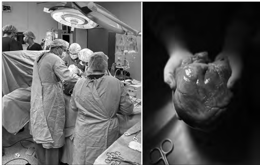
Фото зі сторінки лікарні у Фейсбуці.