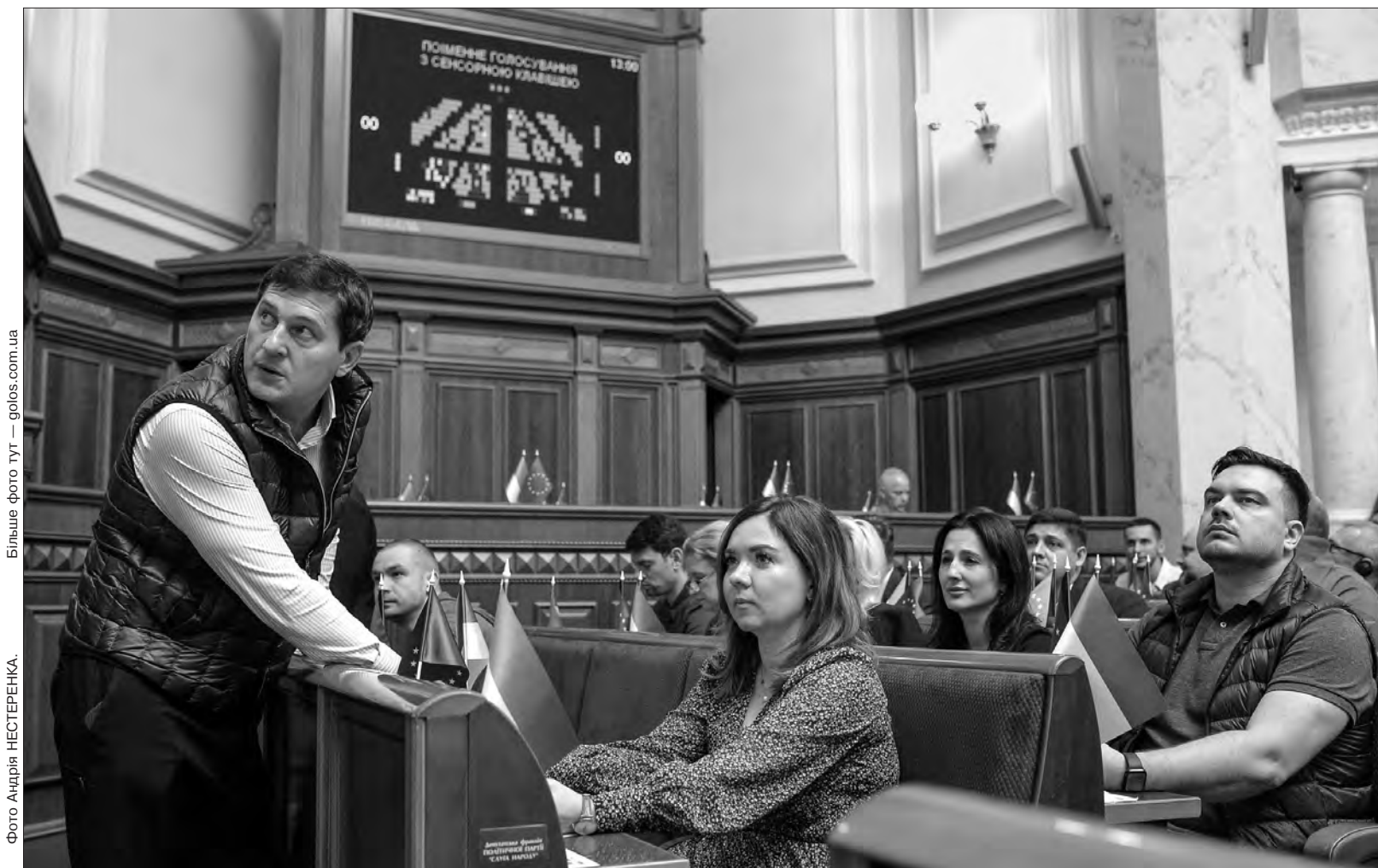
Більше фото тут — golos.com.ua