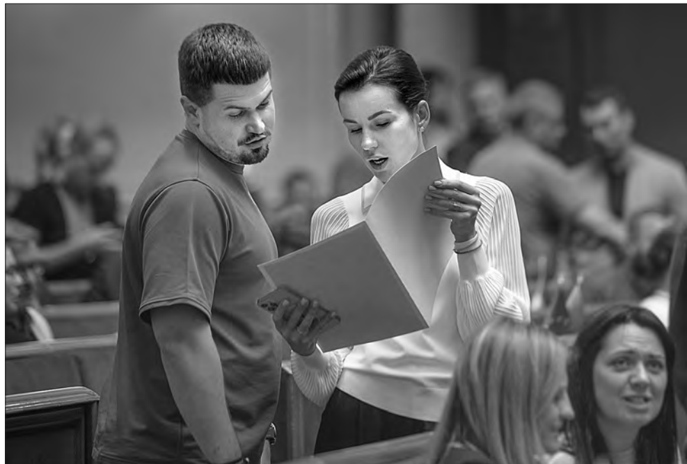
Під час засідання.